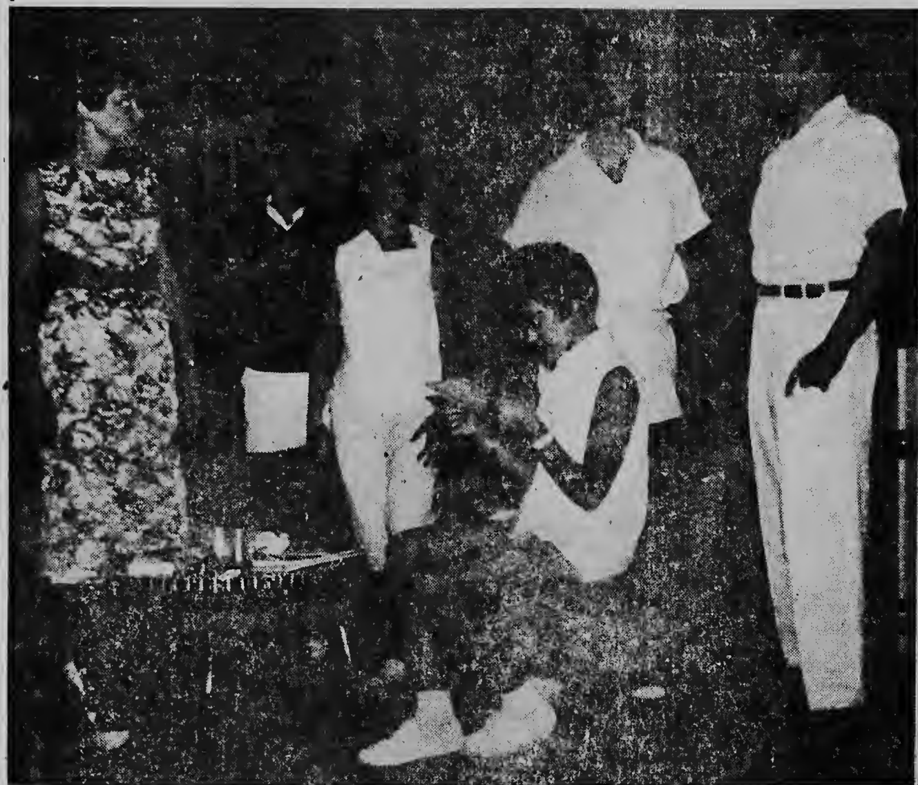
Un escena di comedia „En, Toen kwam Oma” di A.N.V. durante di e prome acto den cas di famia Hartley.